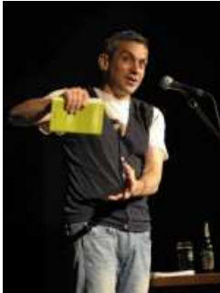
Wladimir Kaminer hat drei seiner Bücher dabei.

Der Autor Wladimir Kaminer begeistert in der Kufa mit unbekanntem Geschichten.